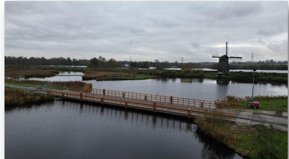
Werkzaamheden aan de pikpotweg brug