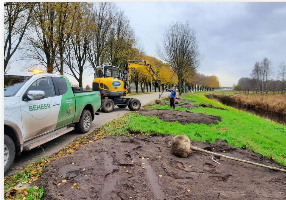
Bomen planten in Het Twiske