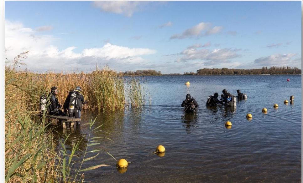
Duikers in Het Twiske.