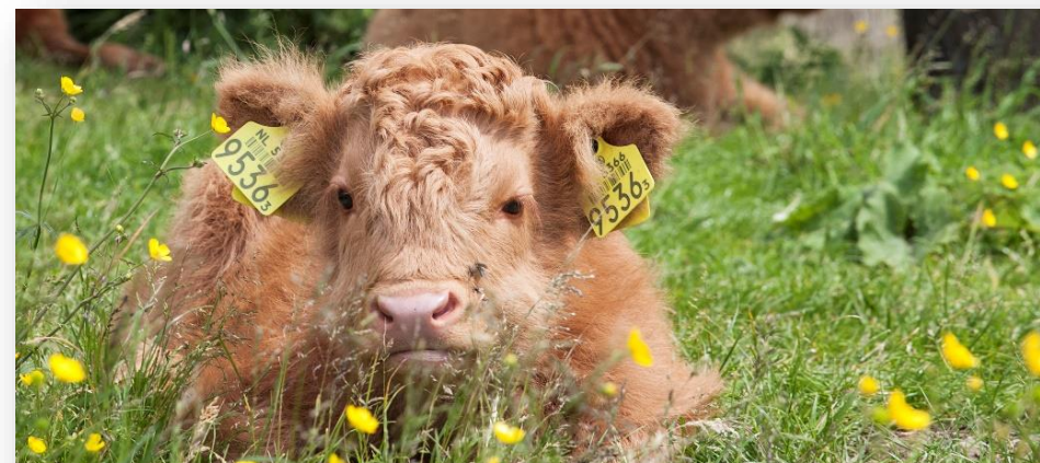
Schotse hooglander in Het Twiske