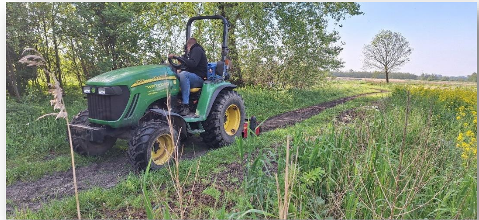
Onderhoud aan de ruiterspaden in Het Twiske

Dit taakveld bevat het zorgen voor een schoon- en veilig recreatiegebied door het jaarlijks terugkerend onderhoud, groot onderhoud en vervangingsinvesteringen. Daarnaast wordt inzet gepleegd ten behoeve van 2 e tranche natuurherstelmaatregelen, het bevorderen van biodiversiteit door aanpassingen in beheer en onderhoud.