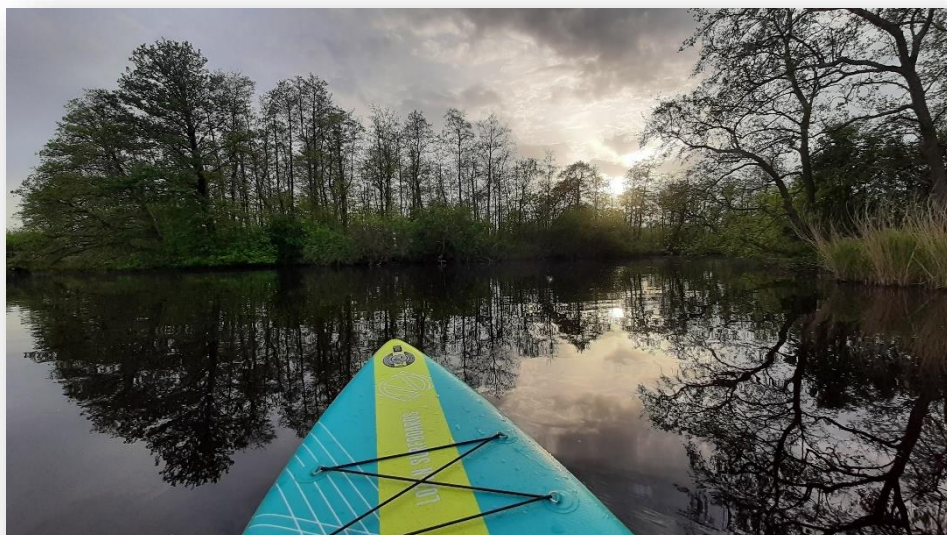
Suppen in Het Twiske