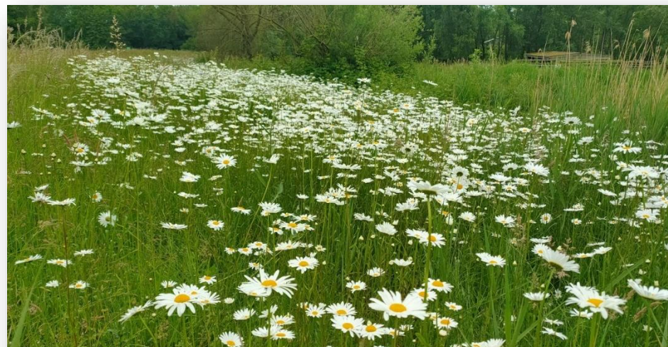
Natuur inclusieve berm