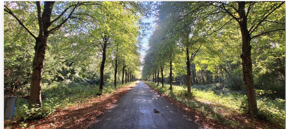
De Noorderlaik in de herfst