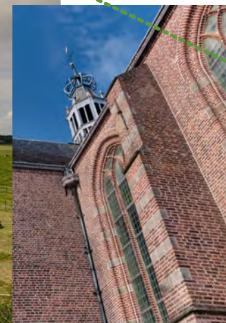
Grote Kerk Oosthuizen

tafel verdeeld in tientallen rechte, gelijkmatige stukken. Aan deze unieke inrichting heeft De Beemster sinds 1999 haar UNESCO-status te danken. Vanaf dit punt heb je een goed zicht op de bijzondere structuur van de polder én het grote verschil in waterniveau.