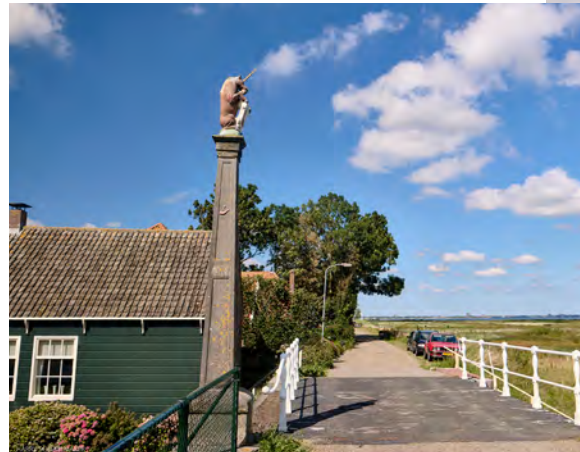
Banpaal in Scharmdam