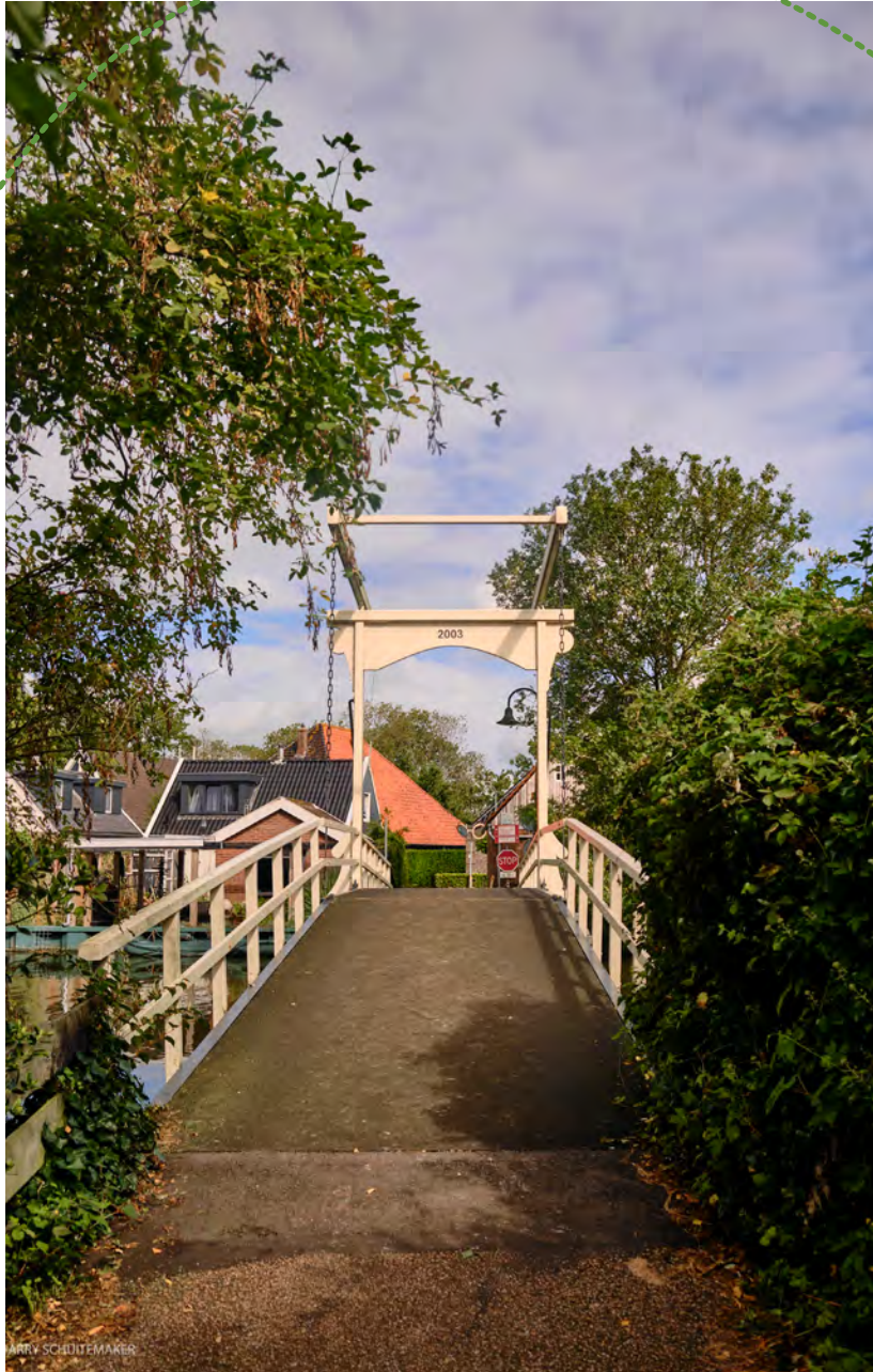
Brug over de Korsloot bij Beets

aanleg van de Schardam in de 14 e eeuw noodzakelijk. Op deze manier werd er een scheiding gecreëerd tussen het binnenwater en zeewater om landverlies tegen te gaan. Sinds de drooglegging van De Beemster dient de Korsloot voor een deel als ringvaart van deze polder.