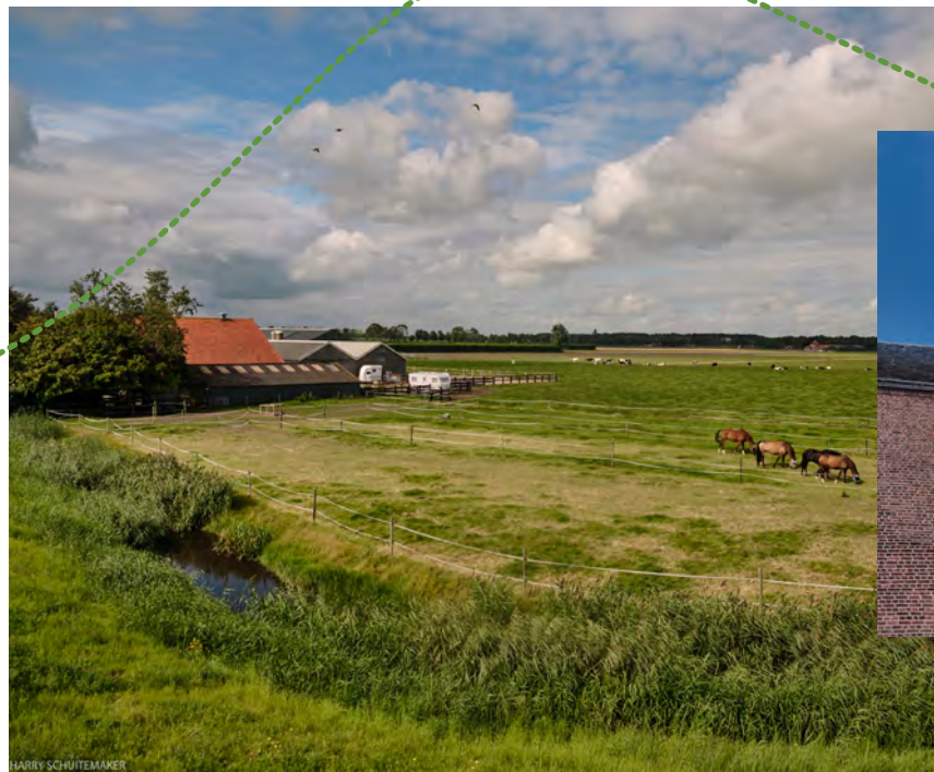
Uitzicht polder Beemster

B Werelderfgoed De Beemster Wandelend over het Beetsdijkje heb je aan de linkerkant een prachtig uitzicht over UNESCO Werelderfgoed De Beemster. Eeuwen geleden werd hier met de inzet van meer dan 40 windmolens de laatste druppel water uit het Beemstermeer gepompt. Het nieuwe land dat overbleef werd aan de teken-