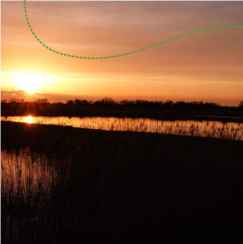
De Volgermeerpolder - Jaap Vermeiden

ook niet voor niets een wonder- gewas genoemd!