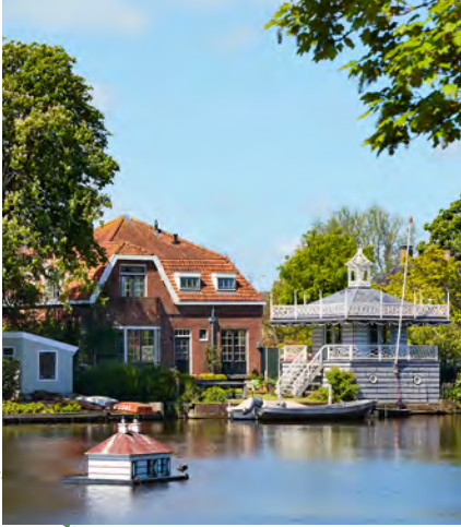
Eendenhuisje op het Havenrak