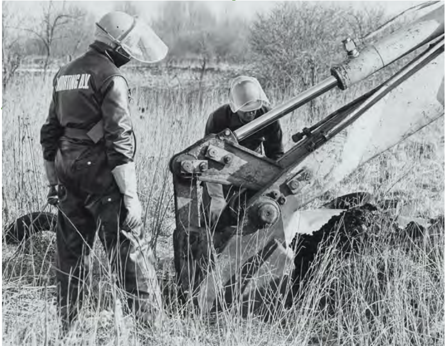
Afval verwijderen in de Volgermeer

kunnen binden waarin ook bacteriële afbraak van verontreiniging kan plaatsvinden. Hierdoor blijven de gifstoffen waarschijnlijk binnen de grenzen van het gebied en worden veel gifstoffen langzaam afgebroken. Door de belangrijke rol van de veenbodem heeft men in de Volgermeerpolder gekozen voor een nieuwe vorm van sanering. Hierbij wordt het gebied hersteld. Zo is ervoor gekozen de verontreinigde grond