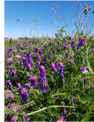
Flora en fauna in de Volgermeer - Jaap Vermeiden

I Flora en fauna in overvloed Vanaf hier heb je aan de linkerkant een prachtig uitzicht op de Volgermeerpolder. Anders dan in het andere deel van de Volgermeerpolder wordt hier ongeveer één á twee keer per jaar gemaaid. Ieder jaar trekken veel weidevogels naar dit gebied om te broeden. Naast