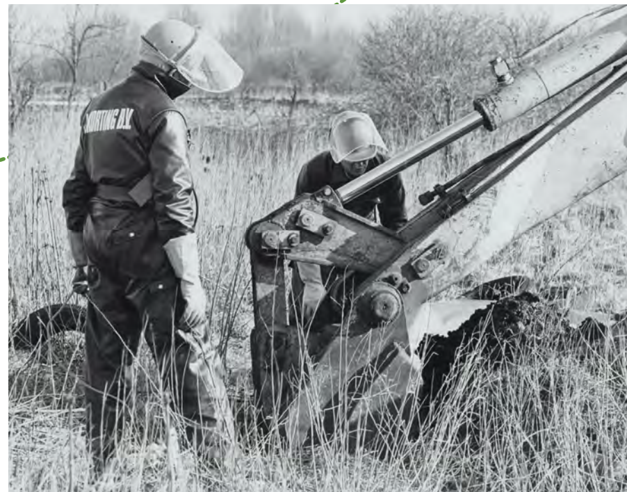
Afval verwijderen in de Volgermeer

De veenbodem - waaruit de Volgermeer bestaat - heeft hierin een belangrijke rol gespeeld. Veen staat er namelijk om bekend weinig water door te laten en stoffen te