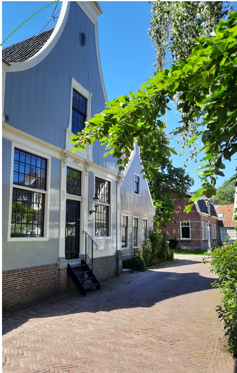
Broek in Waterland

Deze wandelroute start bij Startpunt Broek in Waterland, navigatie: Parkeerplaats Moerland, Broek in Waterland. Je kunt hier gemakkelijk parkeren en net als bij ieder startpunt van Wandelnetwerk Noord-Holland staat er een informatiebord, met de mooiste wandelroutes in de directe omgeving. De routes zijn in twee richtingen bewegwijzerd met gekleurde pijlen.