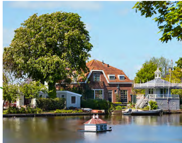
Eendenhuisje op het Havenrak