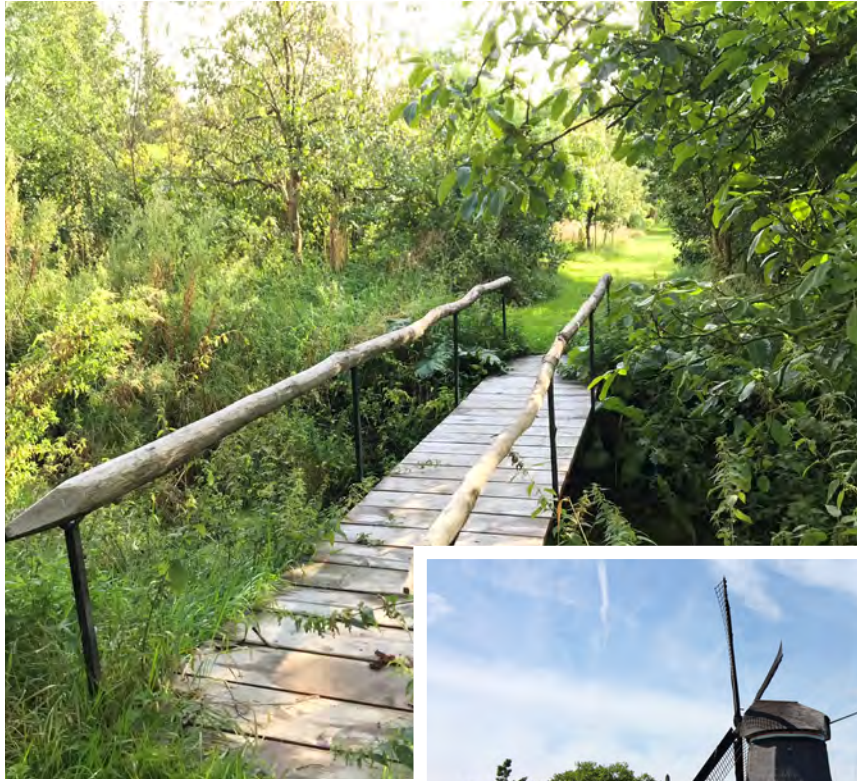
Brug bij Arboretum - M.L. Slot-Dekker

Terwijl je over de Zuiddijk loopt, kun je de verkavelingen goed zien. Deze lange dijk is samen met de Oostdijk om het vroegere Bamestrameer aangelegd met daar omheen een ringvaart. Ook wel bekend als de Beemsterringvaart. Hierna is men met behulp van meer dan 40 windmolens gestart met het leegpompen van het meer. Zo is uiteindelijk Droogmakerij de Beemster ontstaan. Verderop in de routebeschrijving lees je hier meer over.