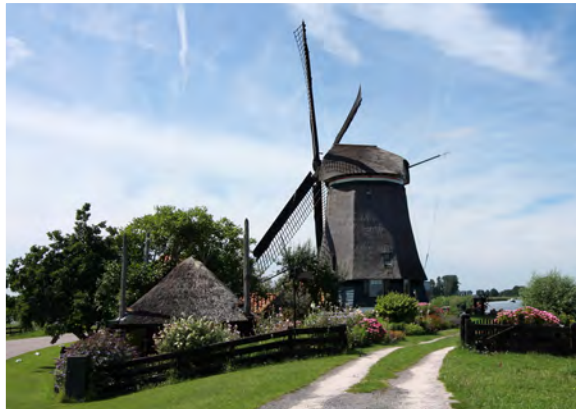
De Neckermolen - Mary Stomph

Terwijl je over de Zuiddijk loopt, kun je de verkavelingen goed zien. Deze lange dijk is samen met de Oostdijk om het vroegere Bamestrameer aangelegd met daar omheen een ringvaart. Ook wel bekend als de Beemsterringvaart. Hierna is men met behulp van meer dan 40 windmolens gestart met het leegpompen van het meer. Zo is uiteindelijk Droogmakerij de Beemster ontstaan. Verderop in de routebeschrijving lees je hier meer over.