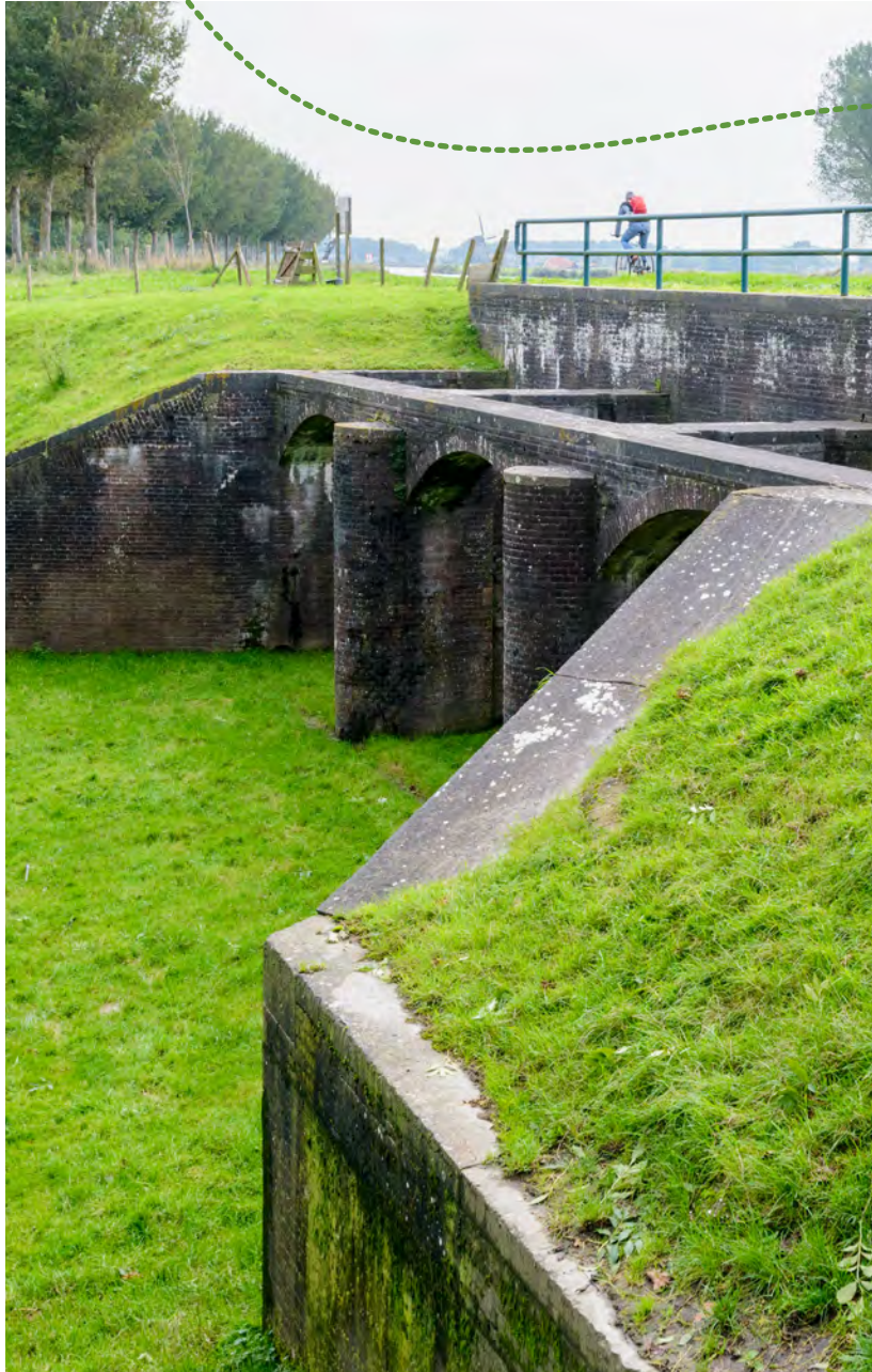
Inundatiesluis Zuidelijke Beemsterringdijk - Martin van Lokven