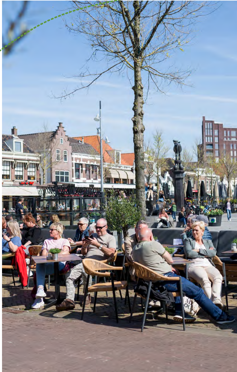
Gezelligheid op de Koemarkt in Purmerend - Moments by Kelly