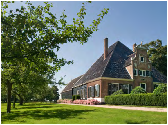
Boerderij de Eenhoorn