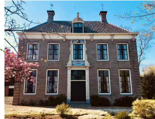
Rustenhove - M.L. Slot-Dekker