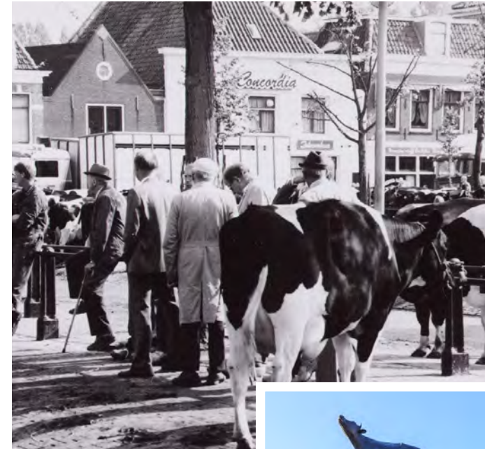
De Koemarkt van vroeger